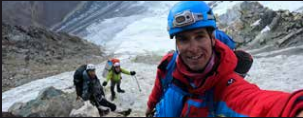
Ekaitz Maíz «Pamir, hielo y roca»